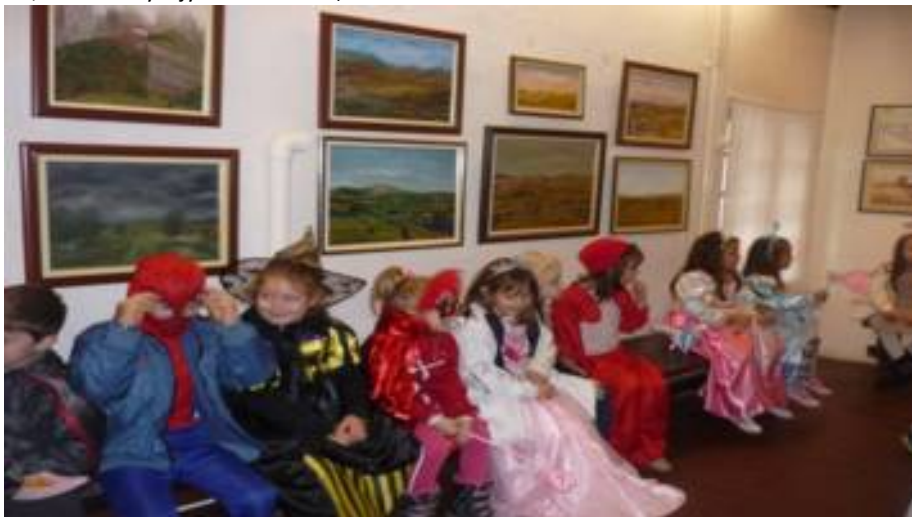
- Посета музеју и Радул-беговом конаку, Архиву

*15.10.2014. одржана је Дечја олимпијада у организацији Црвеног крста Зајечар и Спортског савеза Зајечар. Олимпијада је традиционално одржана у ОШ „Љубица Радосављевић-Нада“. Учествовало је 6 екипа ученика 4. разреда основних школа, који су се такмичили у спретности и брзини на полигону са препрекама. Ученици ОШ „Ђура Јакшић“ су освојили 1.место.