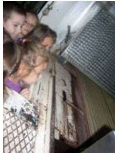
- Посета „Житопрometу“ - Маскенбал, посета музеју и библиотеци